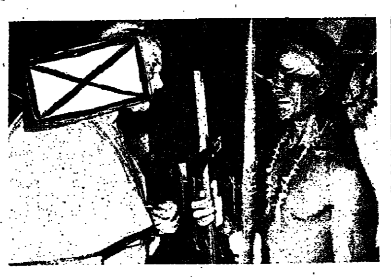
حاضرة الفاتكان - عاد قدامه اليابا يوحنا بولس الثاني أمس الى حاضرة الفاتكان في ختام زيارة للبرازيل...